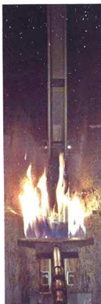
Fotografia del campione nella fase finale della prova.