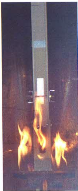
Fotografia del campione nella fase iniziale della prova.