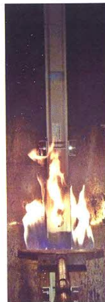
Fotografia del campione nella fase intermedia della prova.